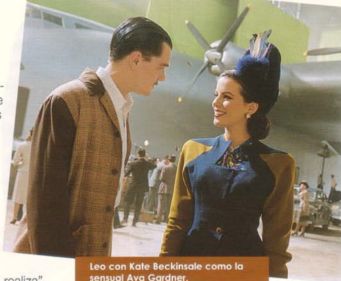
Leo con Kate Beckinsale como la sensual Ava Gardner.

"Es que promover una película es una parte de lo que un actor debe hacer para que la gente aprecie el trabajo que uno realiza".