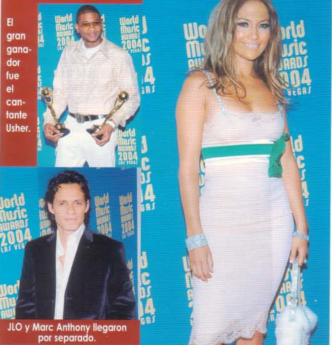
El gran ganador fue el cantante Usher.